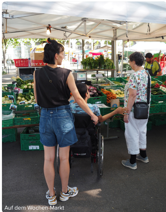
Auf dem Wochen-Markt

«Ich kann im Rahmen der Möglichkeiten meinen eigenen Ideen nachgehen und werde dabei professionell begleitet»