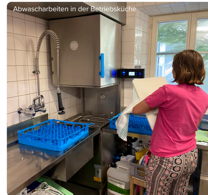
Abwascharbeiten in der Betriebsküche

« die Abwechslung bei den Aufgaben gefällt mir. Den jährlichen Team-Ausflug finde ich cool! Wir sind ein gutes Team. »