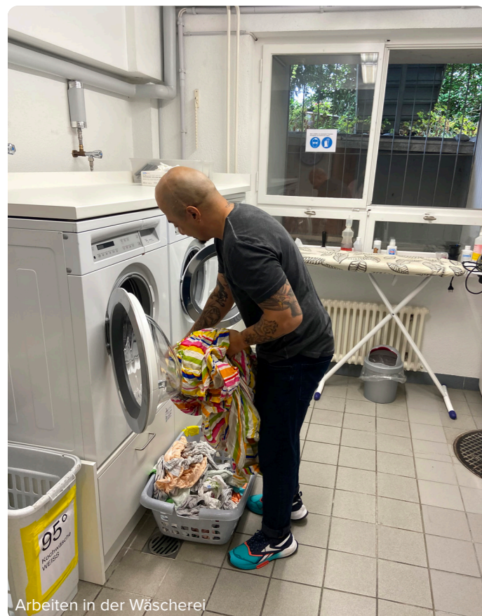
Arbeiten in der Wäscherei

«Die Umgebung ist grossartig. Es ist so nahe am Bahnhof - und nach dem Feierabend hat es so viele Möglichkeiten etwas zu unternehmen.»