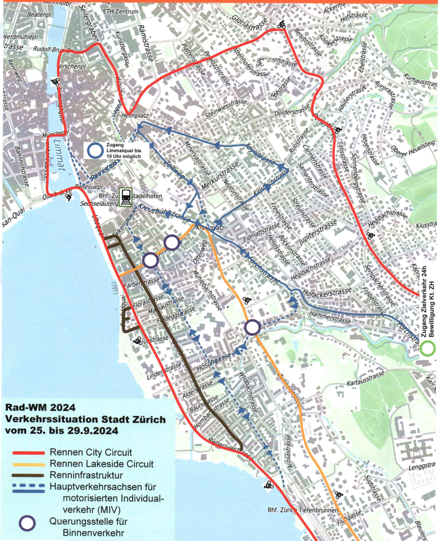
Abbildung 3: Fahrbeziehungen und Querungsstellen in den Gebieten Innenstadt, Bellevue und Zürich-Ost vom 25. bis 29.9.2024